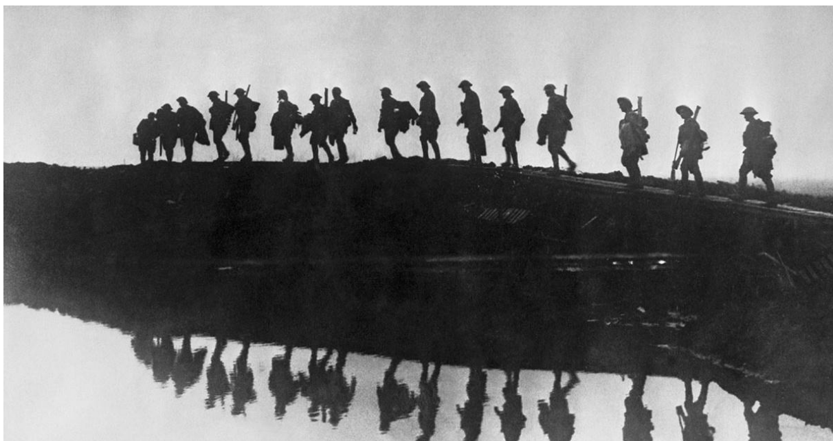
Primera Guerra Mundial

Busca un llibre que pugui estar relacionat amb aquesta imatge per a documentar-te i escriu l'inici d'una història inventada (de dues línies) basant-te en aquest.