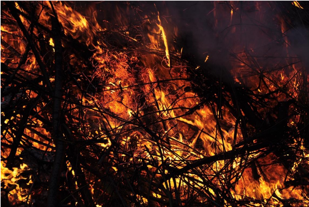
Foc a un bosc

Busca un llibre que pugui estar relacionat amb aquesta imatge per a documentar-te i escriu l'inici d'una història inventada (de dues línies) basant-te en aquest.