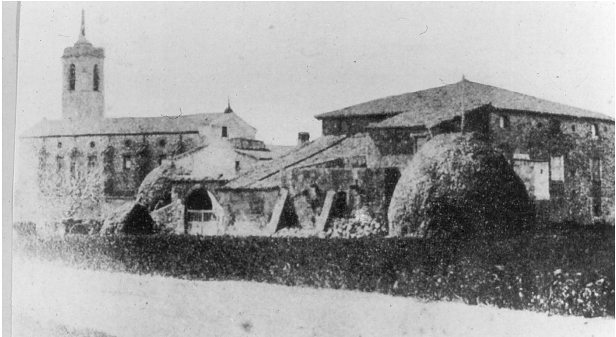
Antiga església de Santa Maria de Cornellà de Llobregat, enderrocada l'any 1936

Busca un llibre que pugui estar relacionat amb aquesta imatge per a documentar-te i escriu l'inici d'una història inventada (de dues línies) basant-te en aquest.