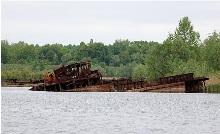
Antiga ciutat de Chernobyl

Busca un llibre que pugui estar relacionat amb aquesta imatge per a documentar-te i escriu l'inici d'una història inventada (de dues línies) basant-te en aquest.